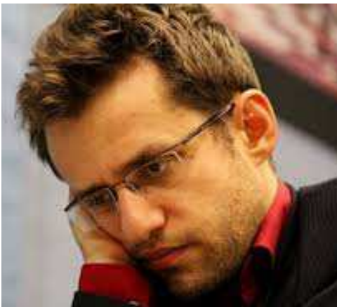
Levon Aronian. Fik noget at tænke over efter dukkert under førstedagens møde med Tigreren fra Madras.

I Khanty-Mansiysk i Rusland samles i disse dage otte af verdens bedste skakspillere i den såkaldte kandidatturnering. Den vil afgøre, hvem der skal blive den første udfordrer til Magnus Carlsens VM-titel. Blandt forhåndsfavoritterne er armeneren Levon Aronian, verdens pt. næsthøjest ratede spiller (2830). Favoritten var dog den, der kom værst fra start af alle på turneringens førstedag, hvor han tabte til den detroniserede VM-tiger fra Madras, Wiswanathan Anand (2770).