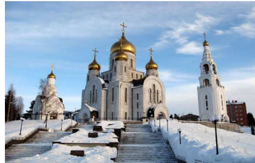
Kirke i Khanty-Mansiysk, olieboombyen i Rusland, der er vært for årets kandidatturnering.

På andendagen fik Aronian en pind mod Mamedyarov, som også på tredjedagen måtte smide en pind - til Anand! Derefter ligger Anand alene i front med 2½ point af 3, fulgt af Svidler og Kramnik med 2, Aronian og Topalov med 1½, Andreikin og Karjakin med 1, mens Mamedyarov lukker bunden med en halv. Kandidaterne spiller en dobbeltrunde frem til den 30. marts 2014. Selve VM-dysten mod Carlsen skal spilles fra den 5. til den 25. november 2014.