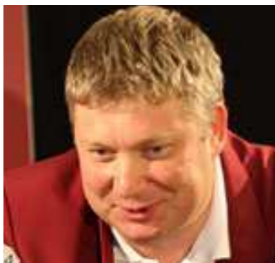
GM Alexey Shirov. I højt humør efter en omgang Stegt Lever i Tromsø.