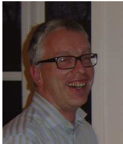
Doktor D. Har ind til videre haft en forrygende sæson i 2014. Mod Christian missedede han dog en mat i 8 og måtte smide en halv.

I tidligere numre af SKAKPOSTEN har jeg gennemgået eksempler, hvor det afgørende øjeblik faldt ud til min fordel.